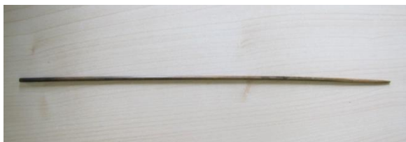
Špejle – pomůcka k rolování papíru