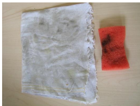
Suchý hadřík, vlhká houbička