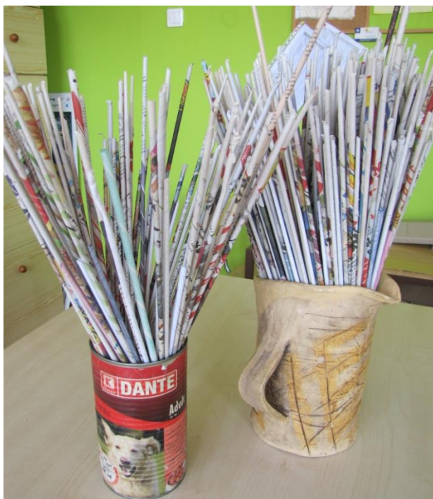
Nádoba na odkládání hotových trubiček

Všechny tyto pomůcky budeme mít připraveny na pracovním místě